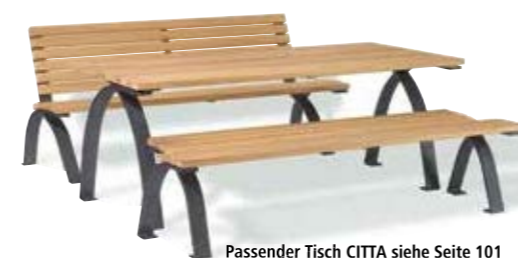
Passender Tisch CITTA siehe Seite 101